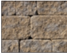
Beige et charbon

NOTE: Nous vous suggérons d'effectuer votre choix final avec de vrais échantillons.