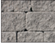
Gris et charbon