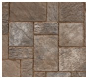
● Beige travertin