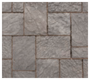
● Gris et charbon