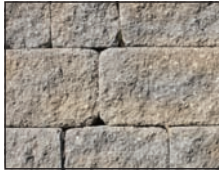
Beige et charbon

NOTE: Nous vous suggérons d'effectuer votre choix final avec de vrais échantillons.