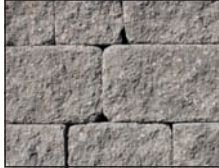
Gris et charbon