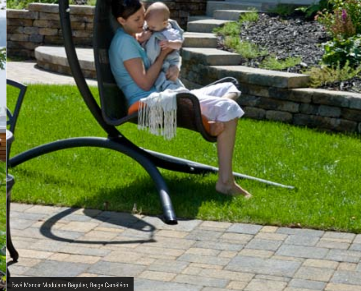
Pavé Manoir Modulaire Régulier, Beige Caméléon