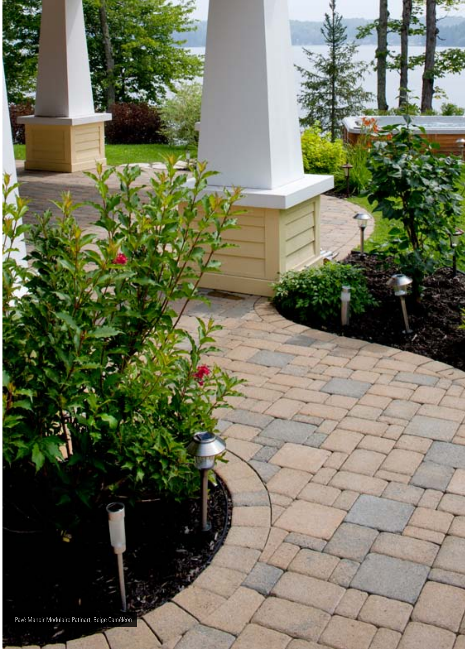
Pavé Manoir Modulaire Patinart, Beige Caméléon

Note: Les pavés 1, 2 et 3 se retrouvent dans le même cube, alors que le pavé 4 est seul dans un cube. Les pavés 5 et 6 se retrouvent ensemble dans le même cube. Module 1, dans un cube le nombre de morceaux de chacune des grandeurs est différents.