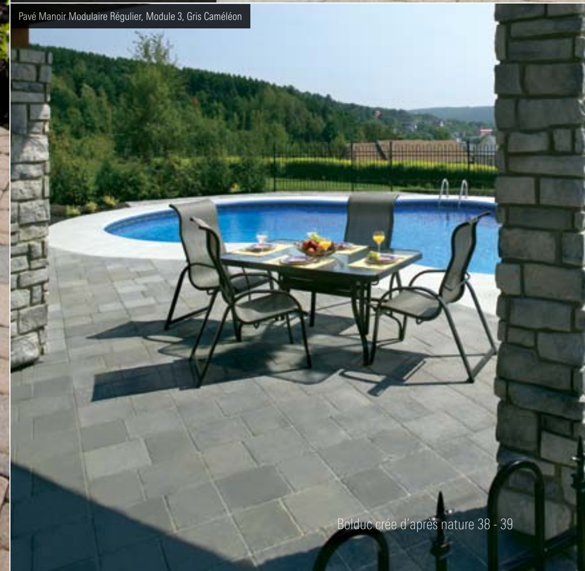
Pavé Manoir Modulaire Régulier, Module 3, Gris Caméléon