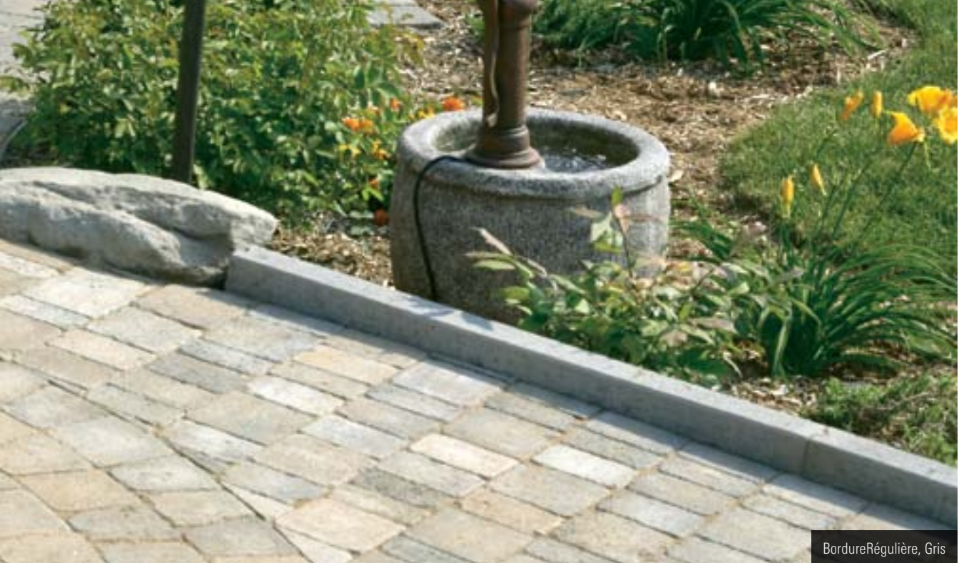
Bordure Régulière, Gris