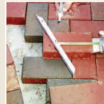
Le mesureur-marqueur de longueur et d'angle