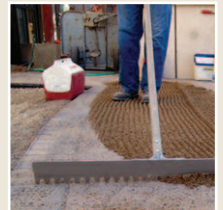
Le râteau en aluminium

Ces bons achats sont tous disponibles dans le catalogue Matériel promotionnel de Bolduc. www.bolduc.ca/articles-promotionnels